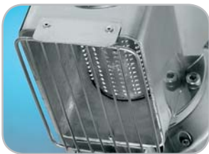
Griglia di protezione rullo inox di serie Protection grate/Standard stainless steel drum