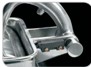
Microinterruttore su grattugia Microwitch on the grater