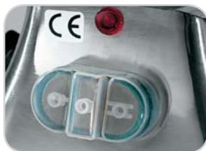
Opzionale: Pulsantiera con inversione di marcia Optional: Push-button panel with reverse